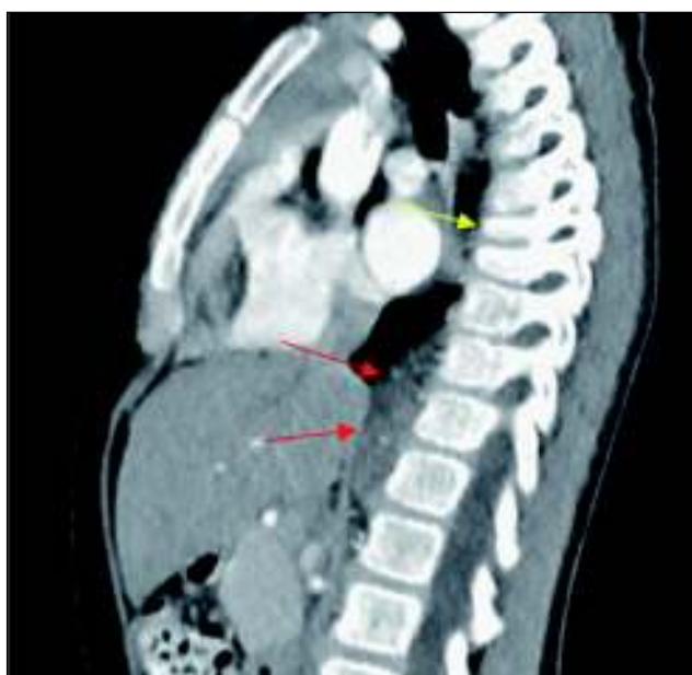
Ryc. 2. Obraz TK klatki piersiowej z kontrastem z uwidocznił guzem okolicy przykręgosłupowej (czerwone strzałki) i złamaniem kompresyjnym trzonów kręgów (żółta strzałka).

Fig. 1. A chest X-ray, anteroposterior view, showing a nodule (marked by arrows).