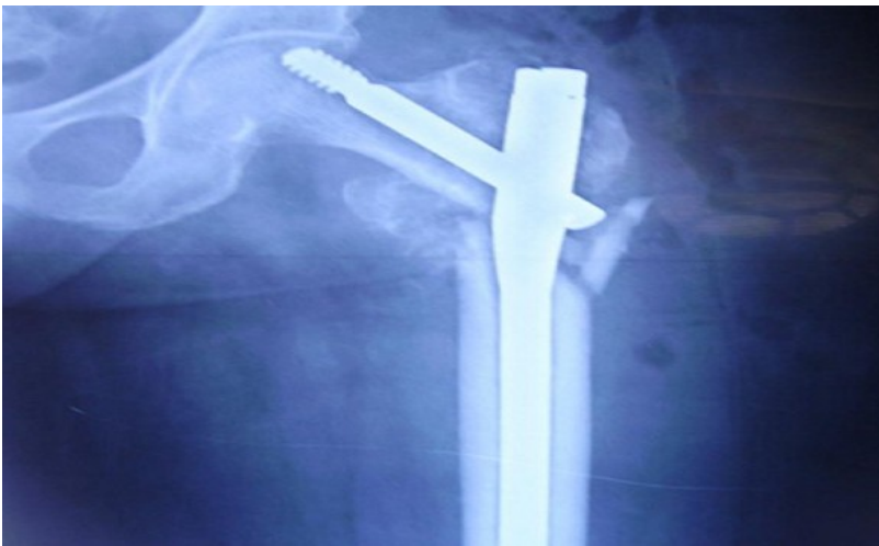
Figure 3: Radiographie de bassin de face en post opératoire immédiat d'une ostéosynthèse par clou gamma long