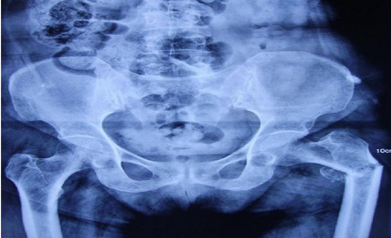
Figure 2: Radiographie de bassin de face objectivant une fracture sous trochantérienne avec ostéolyse manifeste du petit trochanter gauche (après 1 mois)