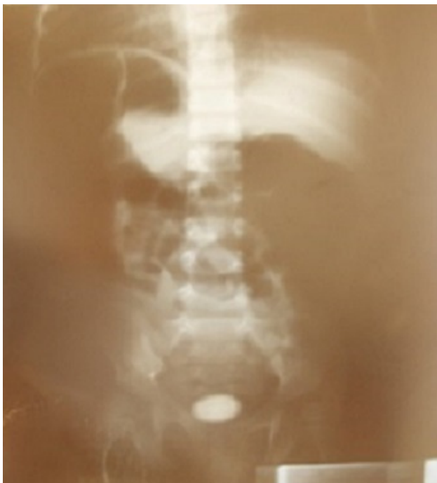
Figure 2: lithiase vésicale stratifiée