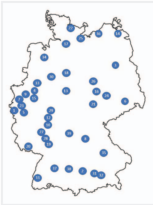
► Abb. 1 Darstellung der an der Studie teilnehmenden HNO-Universitätskliniken in alphabetischer Reihenfolge: 1. Aachen, 2. Augsburg, 3. Berlin, 4. Bochum, 5. Bonn, 6. Dresden, 7. Düsseldorf, 8. Erlangen, 9. Essen, 10. Frankfurt a. M., 11. Freiburg, 12. Gießen, 13. Göttingen, 14. Greifswald, 15. Hagen, 16. Halle/S., 17. Hamburg, 18. Hannover, 19. Heidelberg, 20. Homburg/S., 21. Jena, 22. Kiel, 23. Köln, 24. Leipzig, 25. Lübeck, 26. Magdeburg, 27. Mainz, 28. Mannheim, 29. Marburg, 30. Minden, 31./32. München, 33. Münster, 34. Oldenburg, 35. Regensburg, 36. Rostock, 37. Tübingen, 38. Ulm, 39. Würzburg.

Aussendung erfolgte am 27.04.2020. Die Befragung wurde nach 10 Tagen, am 06.05.2020, beendet.