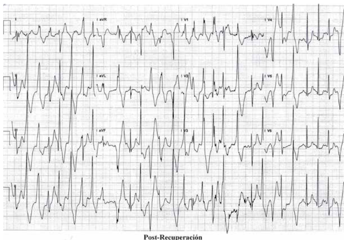
Figura 3. Taquicardia ventricular polimórfica en la etapa de recuperación de la ergometría

Existen varias hipótesis del porqué las mutaciones en RyR2 permiten la TVPC, la mayormente aceptada es que las mutaciones sensibilizan los canales de RyR2 al calcio luminal del retículo sarcoplásmico permitiendo su apertura a una concentración más baja de calcio intracelular, lo que se ha denominado liberación de calcio inducida por sobrecarga de almacenamiento (SOICR, del inglés store overload-induced calcium release ). Según esta hipótesis, al disminuir el umbral de activación se permite fugas de calcio durante la diástole lo cual precipita las arritmias (11) . Otra teoría más reciente sugiere que las mutaciones alteran la interacción interdominios desestabilizando el cierre del canal y permitiendo fugas del Ca^{2+} contenido en el RS (11,13) .