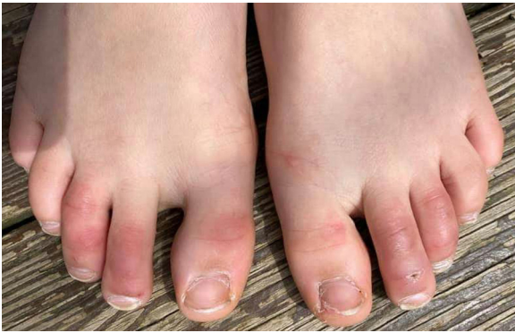
Figura 1 Dedos de Covid en un niño.

a La prevalencia ha sido inferida principalmente de las revisiones sistemáticas recientemente realizadas por Lee et al. 8 , Perna et al. 18 y Zhao et al. 23 .