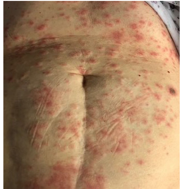
Figura 5 Erupción similar al eritema multiforme.

En abril de 2020 se estableció un registro internacional por parte de ILDS (International League of Dermatological