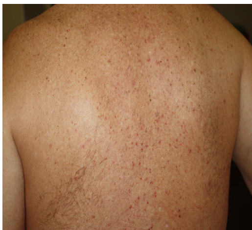
Figura 2 Erupción vesicular.

normalmente leves con aparición de prurito 3 días después del inicio de los síntomas sistémicos, y desaparición al octavo día 13 . En un estudio prospectivo de 24 pacientes infectados de coronavirus, se observó el patrón diseminado de la erupción vesicular en 18 pacientes y patrón localizado en 6. La duración de las lesiones cutáneas osciló entre 4 y 22 días, con una duración media de 10 días. Las lesiones cutáneas surgieron antes de la aparición de los síntomas de COVID-19 en 2 pacientes, con síntomas de COVID-19 en 3 pacientes y tras los síntomas de COVID-19 en 19 pacientes 35 . Los datos histológicos de 3 pacientes con erupción vesicular mostraron acantólisis sin células en balón, disqueratosis, vesículas intraepidérmicas, infiltración eosinofílica dérmica y células multinucleadas sin signos de vasculitis. Las erupciones vesiculares observadas en la COVID-19 difieren del exantema similar a la varicela, donde las características histológicas principales son atipia nuclear, grandes células multinucleadas, acantólisis en balón y vasculitis 36 . Para un reconocimiento preciso del exantema similar a la varicela asociado a la COVID-19 parece necesario descartar el virus herpes simplex-1, el virus herpes simplex-6, y el virus de Epstein-Barr, así como el virus varicela-zóster 37 .