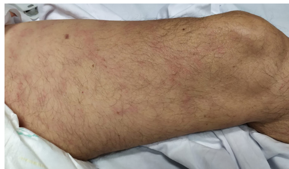
Figura 3 Livedo (crédito de la imagen: Dra. Ana Rodríguez Villa).

La erupción urticarial puede desarrollarse antes del inicio de los síntomas de la COVID-19, y cuando se presenta acompañada de pirexia puede servirnos de pista para el diagnóstico de la enfermedad. Aparece principalmente en el tronco, pero también de manera más generalizada 15,34 . Una paciente española de 61 años con temperatura de 37,3 °C y queja de erupción cutánea progresiva sin otros síntomas de COVID-19 fue positiva a la infección. Esto representa un caso de paciente infectado de COVID-19 sin síntomas típicos, que desarrolló compromiso cutáneo en forma de erupción urticarial. El aspecto clave de este caso es el reconocimiento de los pacientes asintomáticos para prevenir la transmisión del virus 38 . Un caso similar fue reportado por Henry et al. 7 . Se ha reportado la histopatología de estas lesiones que refleja infiltrado linfocítico perivascular, eosinófilos y edema dérmico superior 39 .