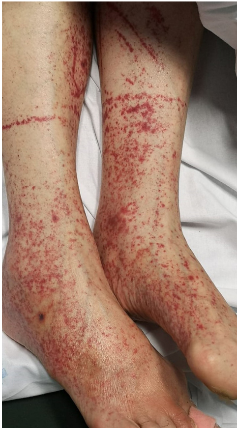
Figura 4 Petequias (crédito de la imagen: Dra. Ana Rodríguez Villa).

glúteos, fosa poplítea, muslo anterior proximal y abdomen inferior. Las erupciones petequiales son sugerentes de COVID-19 leve 6,34,41 .