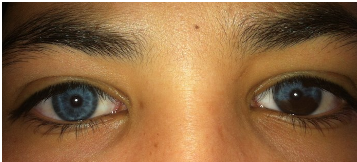
Figure 1: hétérochromie irienne chez une fillette qui présente un syndrome de Waardenbourg