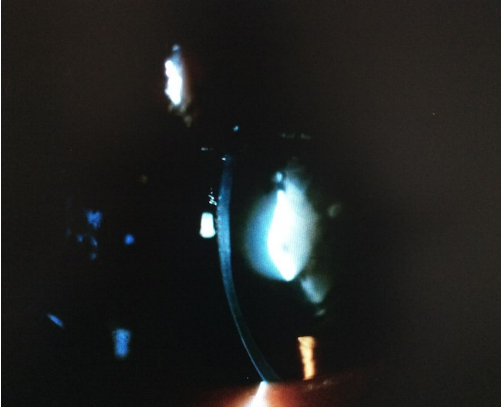
Figure 2: lenticone avec cataracte dans le cadre du syndrome d'Alport