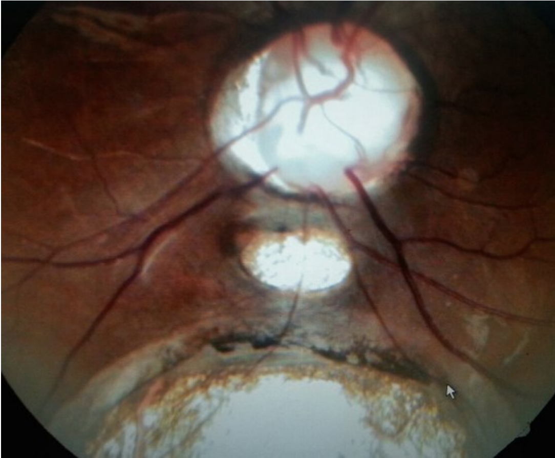
Figure 4: colobome infra papillaire