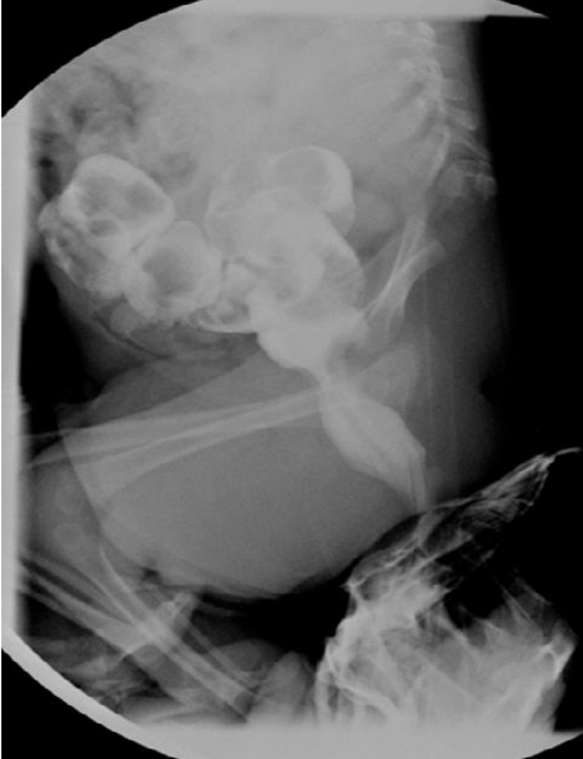
Figure 2: Index baryté: défaut d'expansion rectal siégeant à 5cm de la marge anale, étendu sur 2cm, bien centré, sans distension d'amont mais avec un retard d'évacuation