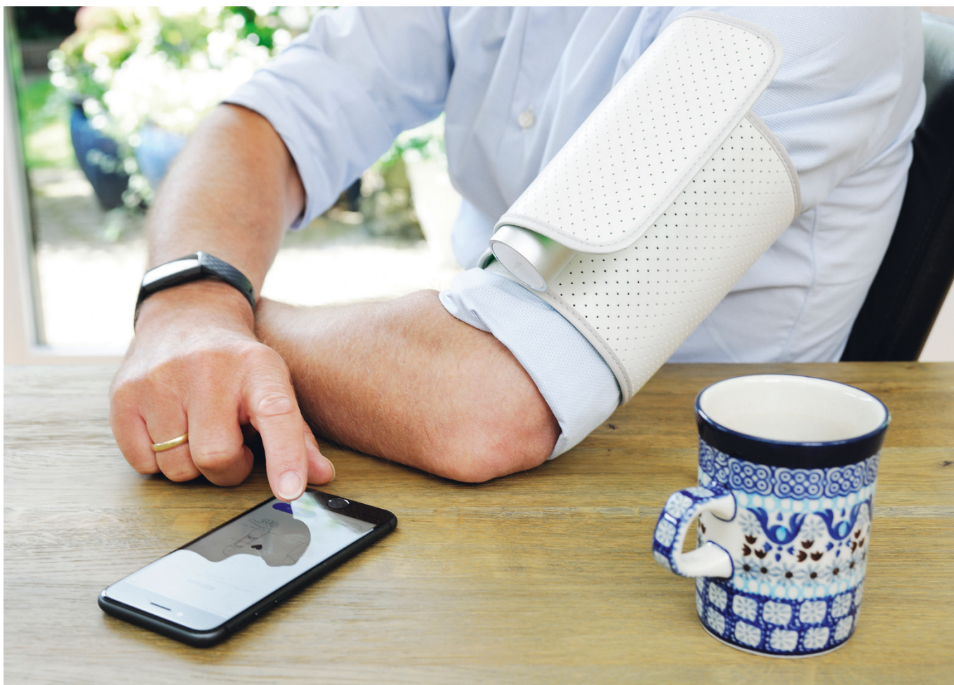
E-health is een bruikbaar alternatief voor fysieke polikliniekbezoeken.

We vroegen de patiënten om enkele keren per week een ecg te maken, en hun bloeddruk en gewicht te meten. Ook verzochten we hen om bij klachten een ecg te maken en de bloeddruk te meten. De resultaten van de bloeddrukmetingen, gewichtsmetingen en de stappenteller waren volledig geïntegreerd in het elektronisch patiëntendossier (EPD-Vision). De patiënten stuurden een pdf van het ecg naar een e-mailadres van het Hart Long Centrum.