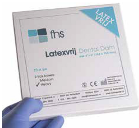
Afb. 6 Heavy non-latex cofferdam van synthetisch isopreen rubber heeft onze voorkeur.