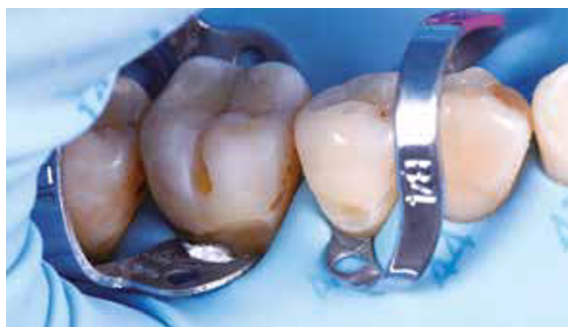
Afb. 5 Een additionele klem is een klem die extra wordt geplaatst om lokaal extra retractie van de rubberdam en gingiva te krijgen. Bijvoorbeeld bij een klasse V-restauratie.