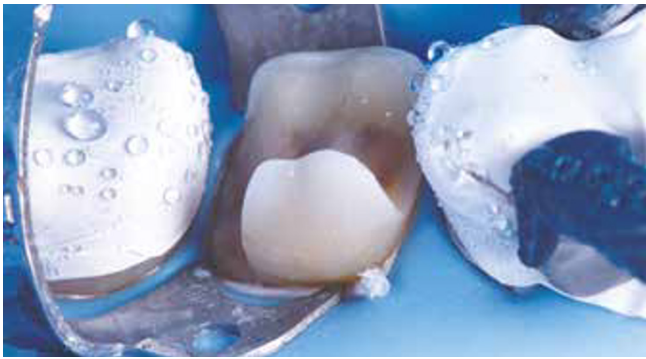
Afb. 10 (Vrijwel) alle restauratieve behandelingen kunnen volledig onder cofferdam worden uitgevoerd; zowel het prepareren als restaureren en/of (adhesief) cementeren.