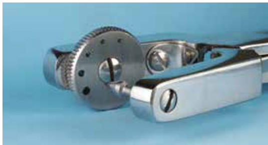
Afb. 3 De Ainsworth-perforator zorgt voor optimale controle en zicht bij het knippen.