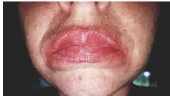
Afb. 9b En hier de situatie 2 dagen na het gebruik van cofferdam (foto door de patiënt gemaakt met de smartphone). Tijdens het werken onder cofferdam merkte de patiënt al op dat de lippen wat begonnen te 'branden'. Overigens werd hier een non-latex (isopreen) cofferdam gebruikt juist om allergische reacties te voorkomen. Zeg dus nooit nooit!

dam zeer geschikt. Denk hierbij aan het sealen van een molaar rond het 6e-7e levensjaar of het uitvoeren van een endodontische behandeling in het front. Zodra er meer gaatjes geknipt moeten worden en het werkveld wordt verruimd, geeft deze dikte in onze ogen te weinig stevigheid en tractie op de weke delen. Daarnaast is de kans op scheuren ook groter wanneer men deze cofferdam door de contactpunten wil halen. Voor restauratieve behandelingen is het daarom aan te raden een heavy cofferdam te nemen. Het nadeel van een heavy of extra heavy cofferdam is dat het lastiger is om deze door de contactpunten te halen. Deze cofferdam zal echter minder snel scheuren en geeft meer weefselretractie. Het is aan te raden om vooraf de contactpunten altijd even met een flossdraad te controleren. Scheurt of rafelt de flossdraad, dan zal de cofferdam waarschijnlijk ook scheuren. In dat geval is het aan te raden dat contactpunt eerst af te werken.