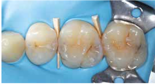
Afb. 1 Tijdens het prepareren onder cofferdam is het verstandig om gebruik te maken van een wig. Deze zorgt voor separatie waardoor het buurelement minder snel geraakt wordt, zorgt voor compressie van de papil en beschermt door de cofferdam tegen schade door de boor.