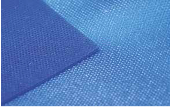
Afb. 8a Gestructureerde cofferdam kan retentie geven aan zand na het zandstralen en is lastiger schoon te krijgen.