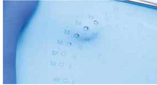
Afb. 2 Let op dat de perforator niet verstopt zit met cofferdam en het wieltje of pinnetje niet beschadigd is. De kleine onregelmatigheid die bij het knippen ontstaat, maakt dat de cofferdam scheurt bij applicatie. In de praktijk blijkt dat het ponsgaatje niet mooi geknipt is en blijft 'hangen'.