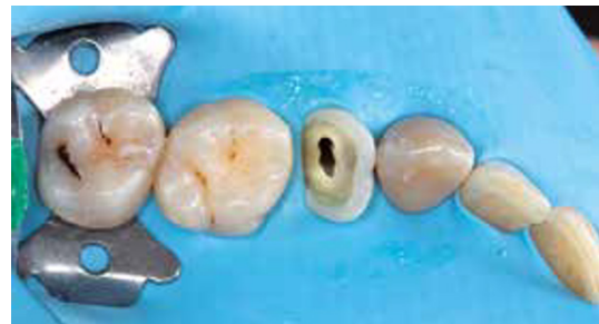
Afb. 4 Een ankerklem is de klem die de rubberdam primair op zijn plek houdt. Dit is altijd de meest distaal geplaatste klem.

heid tijdens het gebruik van rubberdam. De temperatuur was tijdens het gebruik van cofferdam heel constant iets meer dan 30 °C en de relatieve vochtigheid was onder controle. Zodra de cofferdam werd verwijderd namen de temperatuur en de relatieve vochtigheid direct toe. Wij werken in de mond nu eenmaal in een enorm warm en vochtig gebied en onze materialen moeten zich daar maar zien te redden met al hun prachtige chemische eigenschappen (denk bijvoorbeeld aan de hechting). Isolatie is geen slecht wapen om die eigenschappen tot hun recht te laten komen.