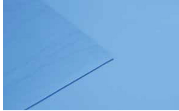
Afb. 8b Gladde cofferdam spoel je makkelijk en snel schoon.