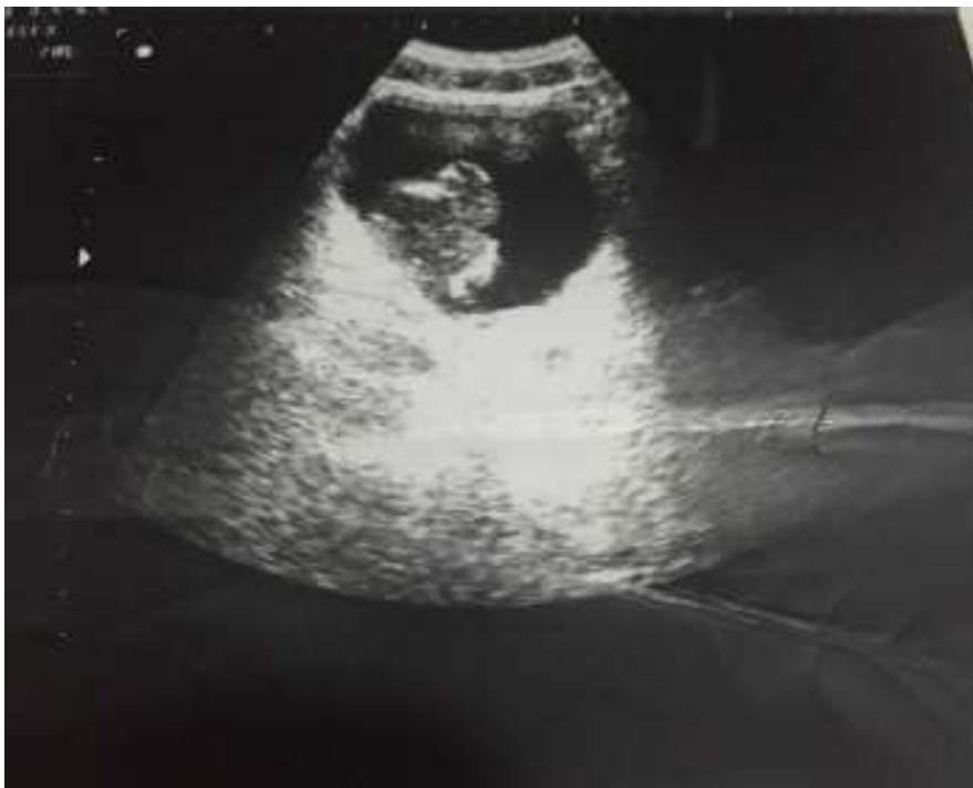
Figure 1: cliché d'échographie montrant un épaissement tumoral bourgeonnant à l'intérieur de la vessie