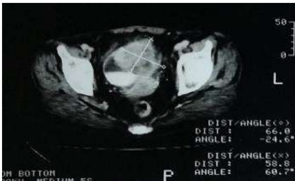
Figure 4: cliché de TDM montrant un processus tumoral vésical de 66x58 mm intéressant le dôme et la paroi antérolatérale gauche avec infiltration de la graisse péri-vésicale