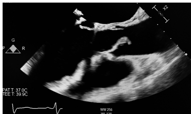
Figura 2. Imagen ecocardiográfica de verruga endocárdica sobre válvula aórtica.

radiografía (fig. 1B), precisando ingreso en la Unidad de Cuidados Intensivos (UCI) y necesidad de ventilación mecánica. Se valoró de forma multidisciplinar y se decidió intervenir de manera emergente, basándonos en las guías actuales de endocarditis, sin quedar claramente definido si la afectación respiratoria era secundaria al proceso vírico o a la patología valvular endocárdica y a pesar del elevado riesgo quirúrgico al asociarse reintervención