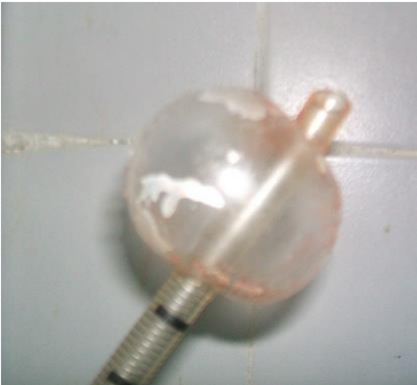
Figure 3: Hernie du ballonnet