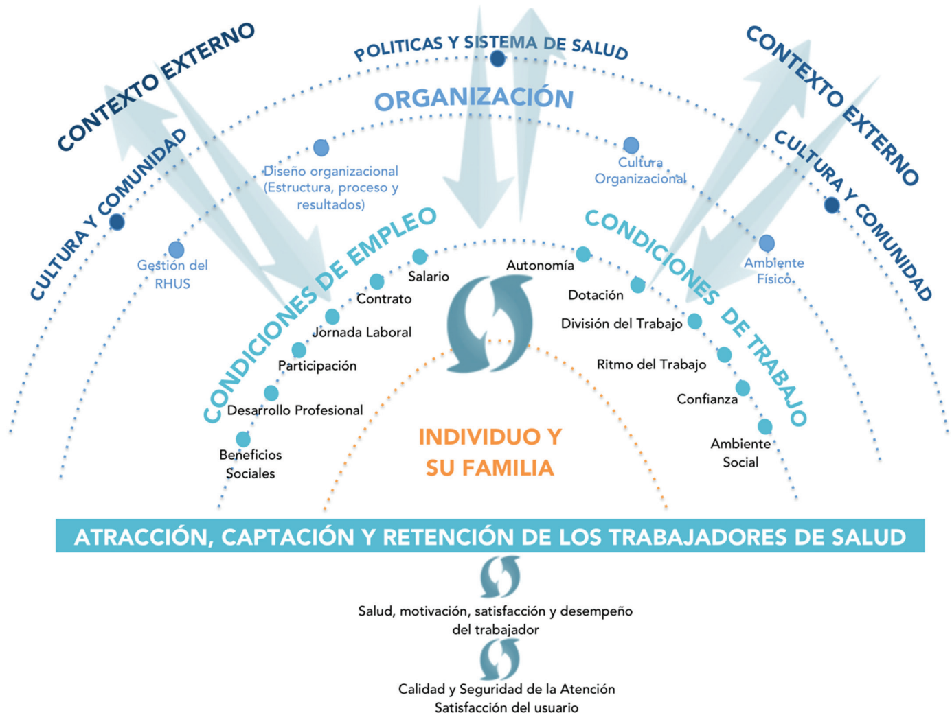
FIGURA 2. Modelo Conceptual sobre condiciones y medio ambientes de trabajo en salud en áreas remotas y rurales a