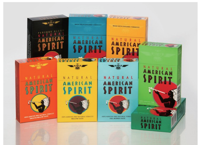
Figure 2. Image of a tobacco brand named “Natural American Spirit.” Natural American Spirit has been widely advertised as “100% additive-free natural tobacco” around the world. Source from: Clarey B. Cover story — 200,000 cigarettes; 2014 [7].