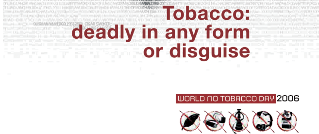
Figure 3. The cover page of the World Health Organization's report, entitled “Tobacco: deadly in any form or disguise.” Philip Morris Korea had translated the title of this report into Korean and had replaced the word “deadly” with “harmful” in their citation of the report.

이미 전 세계 담배회사들은 담배소송에서만은 경쟁을 잊고 서로가 협력하는 형태를 취하고 있다. 담배회사 내부 문건을 분석한 선행연구에서, 국내 담배소송이 처음으로 제기된 시점에 한국담배인삼공사가 경쟁사인 Philip Morris에 소송지원을 요청하는 편지가 소개되기도 하였다[3]. 즉, 담배회사간에 소송에 사용할 자료나 증거물이 서로 공유되고 있을 가능성이 있다는 것이다. 이러한 문제를 극복하기 위해서는 현재 진행 중인 건보공단 소송에서 담배회사들이 제출하는 모든 증거자료에 대해 철저한 검증과정이 필요하다는 것이다. 담배규제분야 전문가들의 적극적인 참여와 개입으로 증거자료,