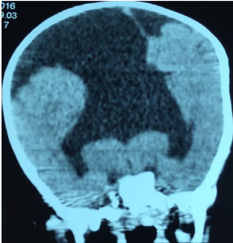
Figure 2: Coupe frontale TDM cérébrale: holoprosencéphalie alobaire