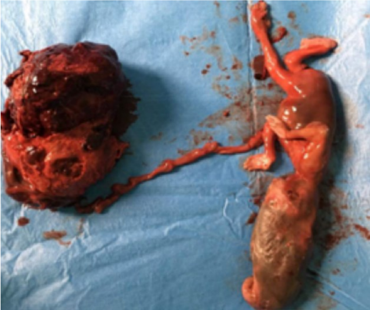
Figure 4: pièce opératoire montrant le fœtus relié à son placenta