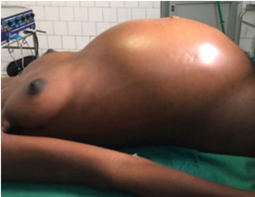
Figure 1: vue pré-opératoire avec abdomen distendu luisant