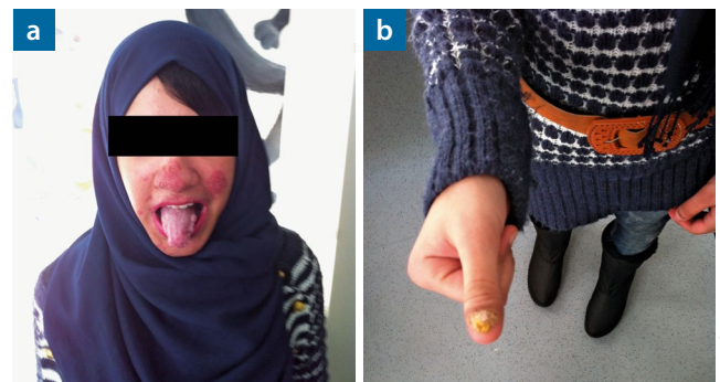
Abb. 3: Chronische Candidainfektion an Haut, Schleimhaut und Nägeln bei einem 17-jährigen Mädchen mit genetischer Störung der natürlichen Immunität gegen Candida-Arten