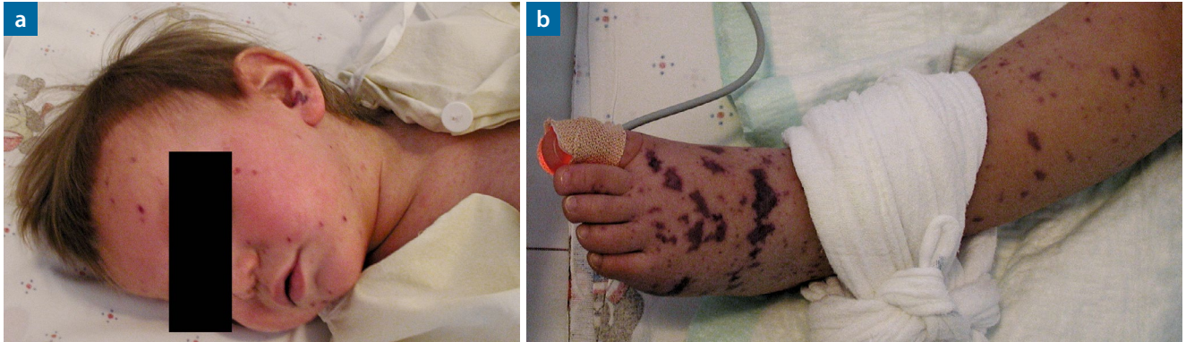
Abb. 2: Meningokokkensepsis bei einem zweijährigen Jungen mit Defekt des späten Komplementfaktors C8