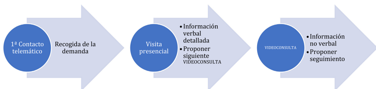
Figura 3. Sugerencia de secuencia asistencial en el abordaje de trastorno por ansiedad combinando visita presencial- no presencial.

La llegada de la pandemia y de las medidas de seguridad de obligada adopción en las consultas presenciales suponen una dificultad añadida en el manejo del paciente respiratorio crónico. Sin poder realizar la demostración con placebo por parte del profesional sanitario, y sin poder visualizar la comprobación de la técnica del paciente con su dispositivo en la consulta presencial, se impone buscar en la telemedicina soluciones que lo permitan. Una adecuada combinación entre visita presencial-videoconsulta-consulta en línea, puede conseguir mejores resultados que los hasta la fecha conseguidos mediante una entrevista presencial exclusiva.