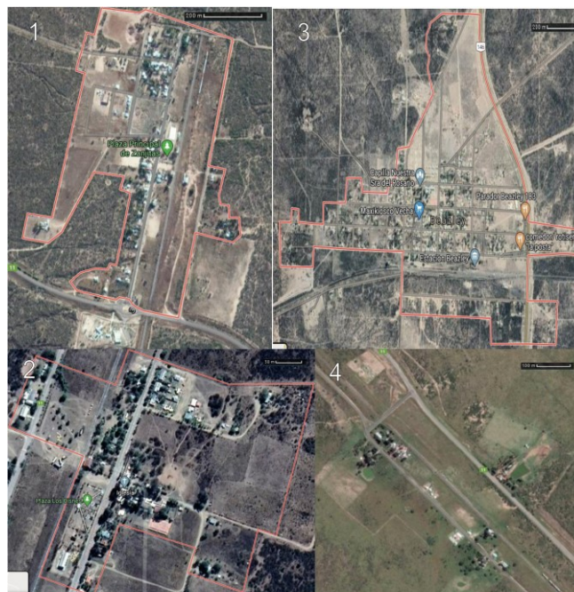
1 Zanjitas - 2 Alto Pelado - 3 Beazley - 4 Cazador

La mayoría de las viviendas del área de estudio se ubican en zona rural agrupada y una proporción menor dispersas (Figura 1); habiéndose registrado en 2010, 45 viviendas en Alto Pelado, 265 en Beazley, 17 en Cazador y 68 en Zanjitas 12 .