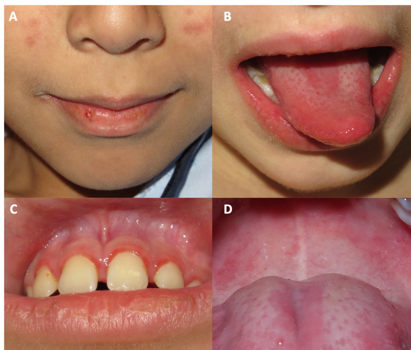
Figura 1 Lesiones en la mucosa oral en pacientes diagnosticados de dermatomiositis juvenil en nuestro hospital durante la pandemia de COVID. A) queilitis; B) lengua depapilada asociada a queilitis; C) eritema y edema en las encías; D) máculas eritematosas y telangiectasias en el paladar.

Estos 5 pacientes con DMJ fueron 3 niños y 2 niñas, con edades comprendidas entre los 8 y los 13 años. Ninguno tenía un antecedente de enfermedad infecciosa ni de vacunación previo al inicio del cuadro. En todos los casos, el síntoma más frecuente fue la astenia, que precedió a las manifestaciones cutáneas. La debilidad muscular proximal