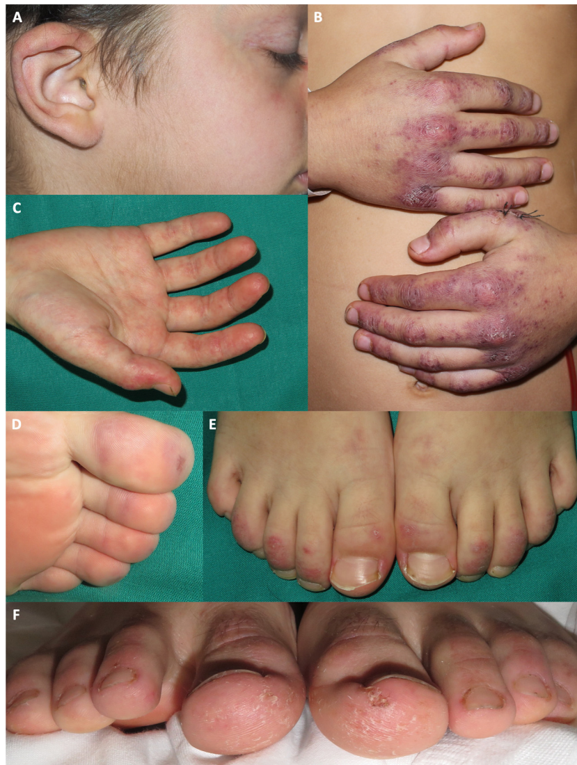
Figura 2 Manifestaciones acrales en pacientes diagnosticados de dermatomiositis juvenil en nuestro hospital durante la pandemia de COVID. Placas eritemato purpúricas en la oreja de un paciente que además presenta telangiectasias en los párpados y queilitis. B) Placas eritemato purpúricas con descamación en el dorso de las manos, con afectación más extensa que la observada en las típicas pápulas de Gottron. C) Eritema palmar. D) Máculas purpúricas los dedos de los pies. E) Placas eritemato descamativas en el dorso de los dedos de los pies. F) Placas eritemato descamativas en los dedos de los pies, asociada a descamación, fisuración y una úlcera en la región plantar de los dedos.

y los hallazgos típicos de dermatomiositis, como eritema en heliotropo, rash malar, eritema y capilares dilatados a nivel periungueal, alteración en las cutículas, pápulas de Gottron y placas eritematodescamativas en codos y rodillas, estuvieron presentes en todos los casos. En 2 pacientes observamos telangiectasias en los párpados. No observamos pápulas de Gottron inversas, eritema flagelado ni eritema en chal.