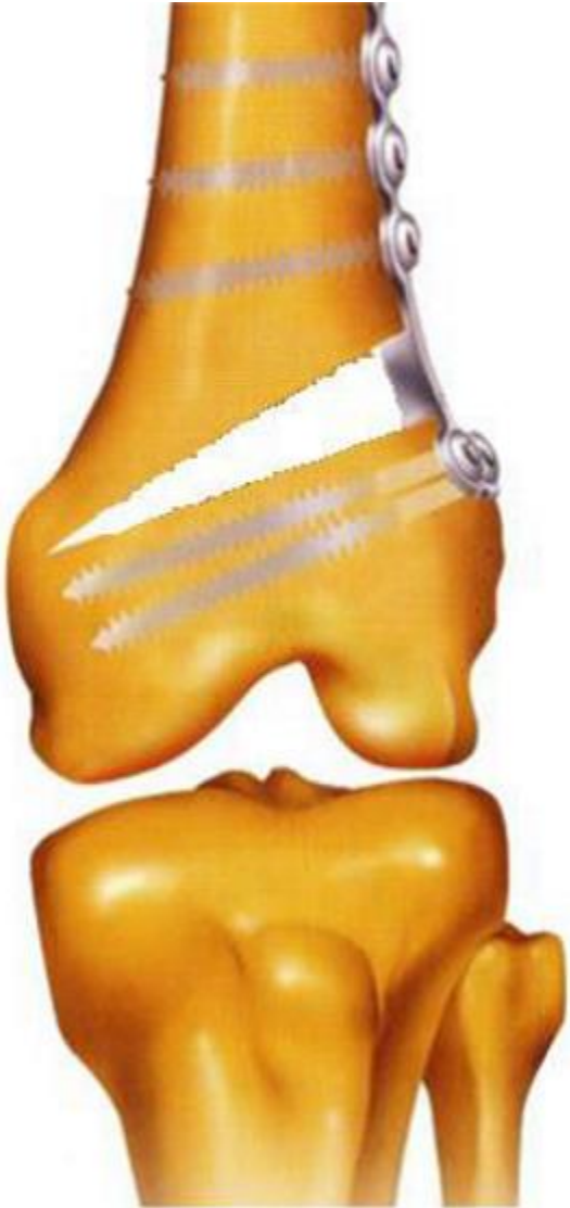
Figure 2: La technique de l'ostéotomie fémorale de varisation par ouverture externe sans interposition de griffon