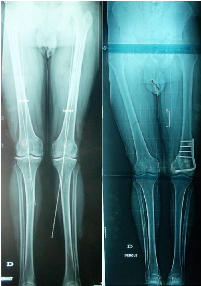
Figure 5: Ostéotomie fémorale de varisation du genou gauche, chez un patient âgé de 51 ans, ayant permis une réduction du valgus de 7° en préopératoire à 3° au dernier recul