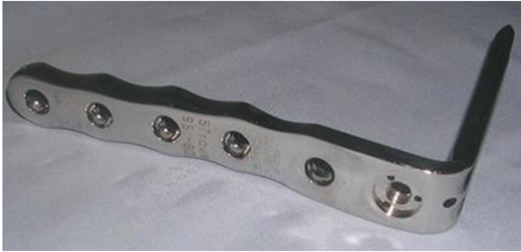
Figure 1: La lame-plaque Strélizia 95