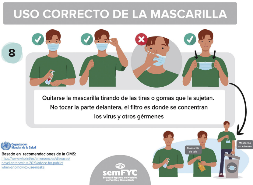
Figura 6 Uso correcto de las mascarillas.

presencial. El mensaje de «llame antes de ir al centro de salud» se topó con la insuficiencia de líneas telefónicas y de personal para atenderlas, ya existente antes en muchos lugares y agravada por el enorme aumento de las llamadas. Pacientes que no conseguían contactar por teléfono y precisaban asistencia o bien renunciaron a ella —con sus consecuencias negativas— o bien acudieron a los servicios de urgencias.