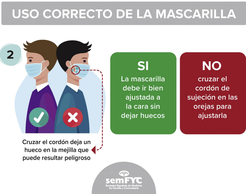
Figura 5 Uso correcto de las mascarillas. Fuente: Infografía 2/8 elaborada por el GdT de Seguridad del Paciente de semFYC.