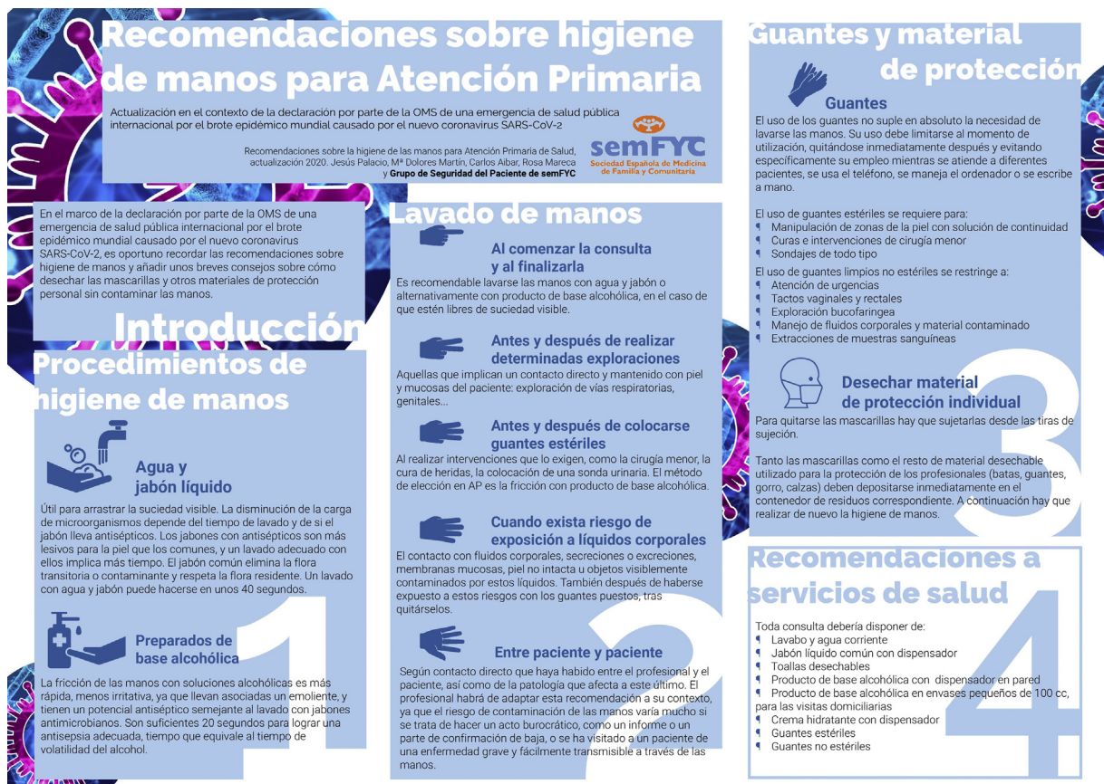
Figura 2 Recomendaciones sobre la higiene de las manos para Atención Primaria de Salud.

Fuente: Palacio et al. Actualización en el contexto de la declaración por parte de la OMS de una emergencia de salud pública internacional por el brote epidémico mundial causado por el nuevo coronavirus SARS-CoV-2 (blog). Infografía.