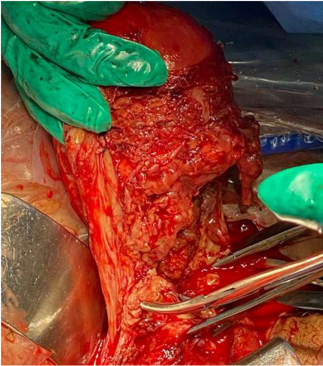
Figure 1: image peropératoire montrant la face antérieure de l'utérus nécrosé et surinfecté