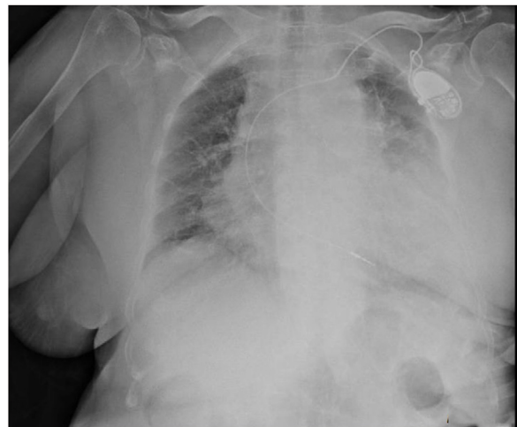
Figura 1 – Radiografía de tórax urgente, en la que se evidenciaban unos hilios pulmonares congestivos, un pequeño derrame pulmonar izquierdo e importante cardiomegalia.

Analizando estudios recientemente aportados como la encuesta nacional sobre tratamiento de las coleditiasis 2 , se estimaba un riesgo anual del 1-3% en complicaciones relacionadas con coleditiasis debido a la suspensión de cirugías electivas ante la situación de pandemia, muchas de estas complicaciones acabarán presentándose como colecistitis que requieran tratamiento urgente. Nuestro paciente parece resaltar también, el hecho de que se presentan casos más evolucionados 3,4 , quizás aún por el miedo al contagio intrahospitalario o la demora en la consulta de los síntomas o al acceso hospitalario, pero además nos impresiona, de forma