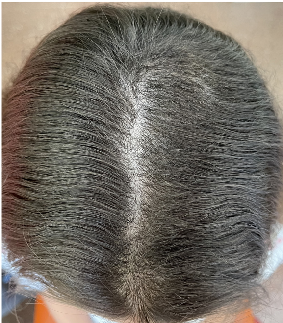
Figura 2 Repoblación del área frontal y occipital, sin áreas de alopecia cicatricial permanente.

ausencia de otros sugestivos de alopecia areata (pelos en signo de exclamación, puntos negros o amarillos) o de tinea capitis (pelos en coma, sacacorchos, zigzag o código morse) fueron determinantes para el diagnóstico.