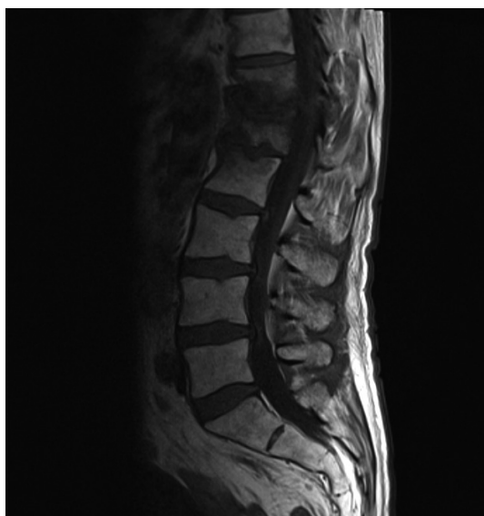
Figura 2 RMN lumbar tras tratamiento con dalbavancina: Cambios de espondilodiscitis desde T12 hasta L1, con cifosis local secundaria. Reducción del absceso paravertebral, más de un 80% de su tamaño.