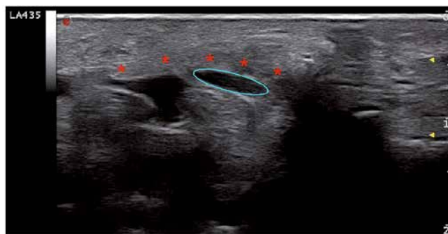
Fig. 1. Transverse view of the carpal tunnel 3 months after surgical median nerve decompression: asterisks mark visible preserved fibers of the flexor retinaculum and an ellipse encircles the entrapped median nerve

Based on information delivered by a follow-up US examination and based on symptoms reported by patients, a cor-