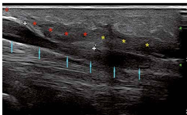
Fig. 2. Longitudinal view of the median nerve 3 months after surgical median nerve decompression: red asterisks mark preserved fibers of the flexor retinaculum, yellow asterisks indicate scar tissue between divided parts of the flexor retinaculum and blue arrows point to the “notch” and “inverted notch” sign

We wczesnym okresie niedocięte włókna troczka łatwo zróżnicować z blizną, gdyż wykazują inną echogeniczność. Początkowo blizna jest hipoechogeniczna i bezpostaciowa, a włókna troczka są hiperechogeniczne oraz wykazują charakterystyczny przebieg w linii więzadła (ryc. 1 i 2). Wraz z postępującą przebudową włóknistą blizny różnicowanie