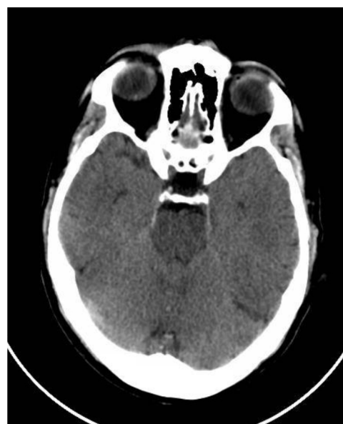
Figura 1 – Corte axial tomografía computarizada craneal: edema cerebral e hipertensión intracraneal idiopática.

Se trata de un varón de 61 años sin antecedentes personales, y no vacunado frente al SARS-CoV-2, que comenzó a consumir por voluntad propia de forma diaria dióxido de cloro con la creencia de prevenir la infección. A las 2 semanas presentó cuadro encefalopático de instauración progresiva con bradipsiquia, desrealización, irritabilidad e inquietud. A la exploración física se evidenció deshidratación cutáneo-mucosa. Se realizó tomografía computarizada (TC) craneal que reveló edema cerebral e hipertensión intracraneal idiopática