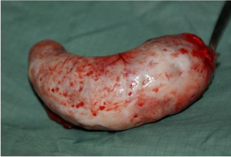
Figure 3: Pièce opératoire (vue de face, Dimensions : 153 mm x 64 mm)