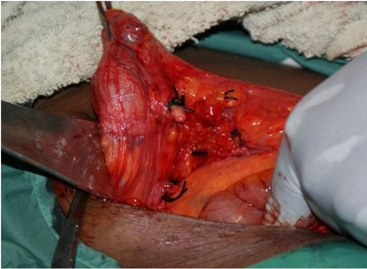
Figure 4: Vue opératoire (après appendicectomie)