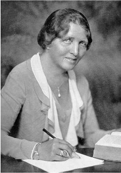
Abb. 2 ▲ Mathilde von Ludendorff als Autorin.

nis hat Ludendorff nie besessen, sonst könnte er nicht immer Einflüssen unterliegen, die ihn ins Unglück stürzen“ [32, S. 276]. Mathilde Ludendorff schildert im Kapitel Der Menschen Niedertracht öffnet dem Glück die Tore im Band 5 ihrer Autobiographie Freiheitskampf wider eine Welt von Feinden [31] wie sie versuchte, mit ihrem ärztlichen Gewissen ins Reine zu kommen: „Wie schwer und unerquicklich ist doch der Arztberuf. Hätte die Patientin die Widerstandskraft bewahrt, dann war ich der Engel, der sie gerettet hatte. Nun trafen mich mit einem Mal Hass und Verleumdung. Gut, dass Ludendorff das nicht ahnte“ [32, S. 47]. Es werde behauptet „eine Ärztin, Frau Dr. v. Kemnitz, habe unter dem Deckmantel ärztlicher Hilfe die Ehe unterwühlt, und Ludendorff sei ihrer Taktik erlegen. So etwa lauteten diese Mitteilungen, die in geringen Abwandlungen in den verschiedensten Zeitungen in ganz Deutschland auftauchten und meine Frauen- und Berufsehre besudeln sollten“ [32, S. 49]. ... „Und sieh da, der Tag war gekommen, der mich in eine Welt des Glückes stellte, eine so völlig andere Welt der seelischen Erfüllung in Zweisamkeit. Es hatte der einsame, für alles seelisch Unnabare, Verschlussene, Grosse, der sich ein Leben lang – oft sogar von seiner nächsten Umgebung –