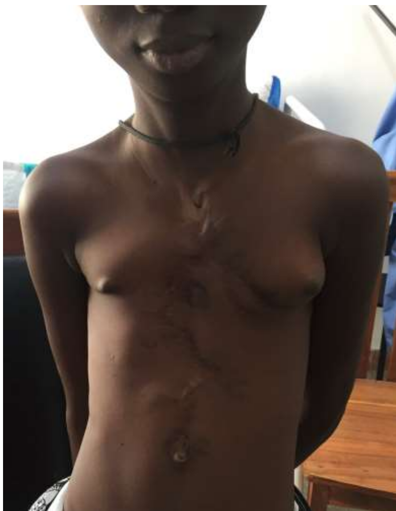
Figure 6: cicatrice de la patiente à l'âge de 13 ans