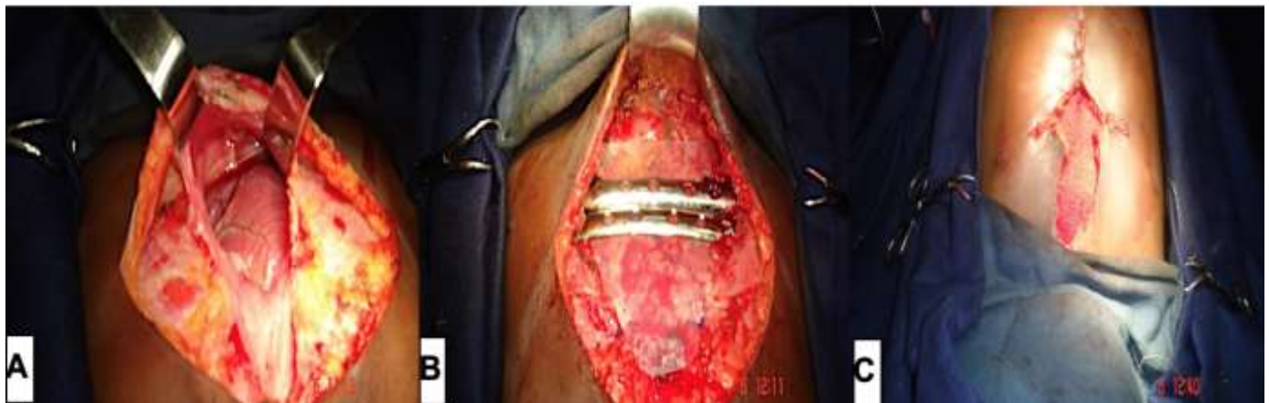
Figure 4: A) aspects opératoires; B) exploration chirurgicale; C) plaques d'acier en place; fermeture du plan cutané