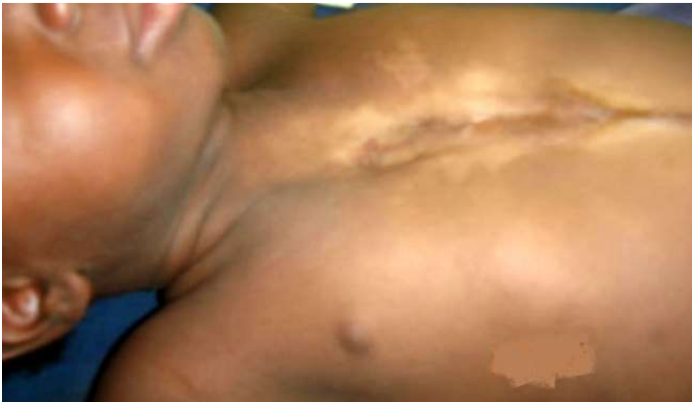
Figure 2: dépression sternale liée aux mouvements paradoxaux