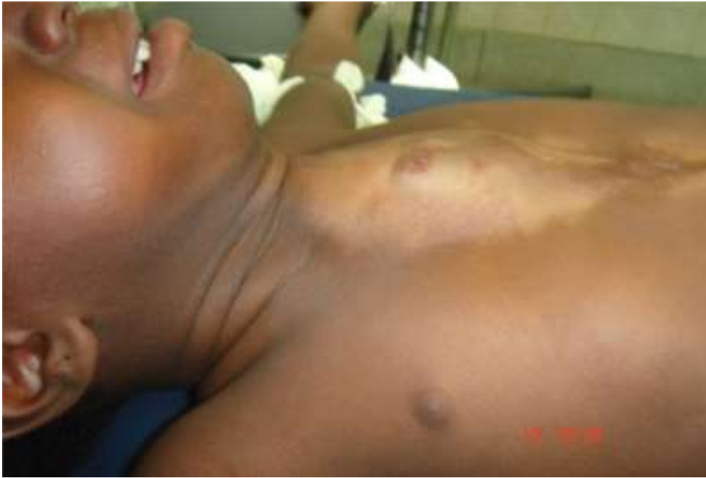
Figure 1: résultat de la cicatrisation dirigée