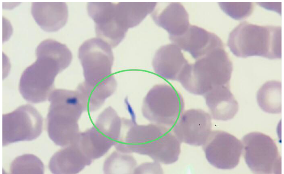
Figura 2. Extendido de sangre periférica, 40X. Se observan eritrocitos sin alteración de la morfología; no se observan leucocitos ni plaquetas. En la región demarcada, se evidencia un tripomastigote.

En el frotis de sangre periférica del día 13 después del trasplante, se detectaron formas parasitarias correspondientes a Trypanosoma (figura 2). Al día siguiente, se enviaron las láminas con el extendido al Instituto Nacional de Salud donde un segundo observador confirmó el hallazgo.