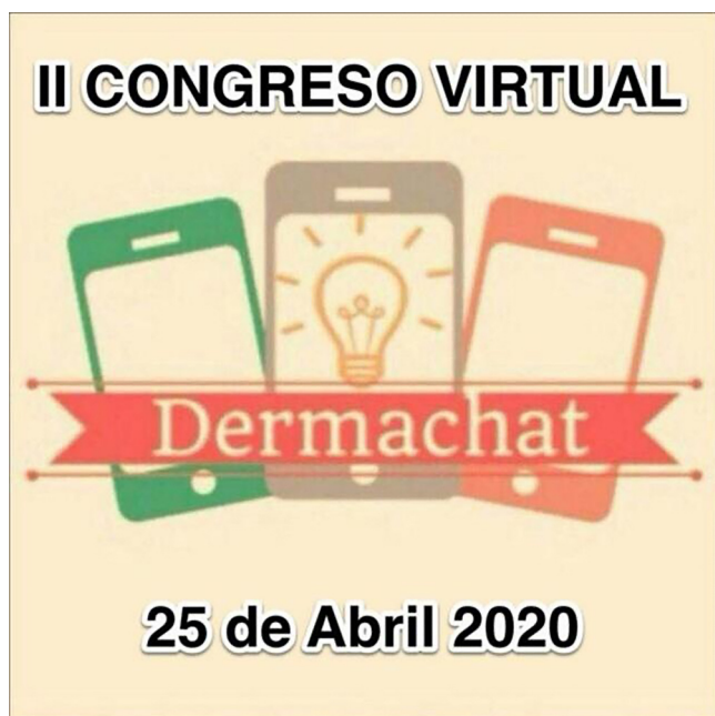
Figura 1 Logo del congreso.

A continuación, puede dejar reflejado cualquier comentario, crítica o sugerencia de mejora para futuras ediciones que considere oportuno