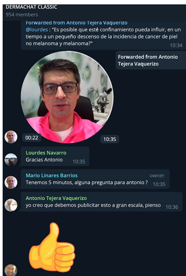
Figura 3 Captura de pantalla del chat durante el debate del 26 de abril de 2020. Las preguntas fueron formuladas durante las presentaciones del día anterior, y los ponentes enviaron sus respuestas a los moderadores previamente, utilizando videos de \leq 1 min que se mostraban uno detrás de otro de forma fluida y con transiciones eficientes (captura de pantalla autorizada por los participantes).

La opinión y las perspectivas futuras de los asistentes se pueden observar en la tabla 4. Todos los