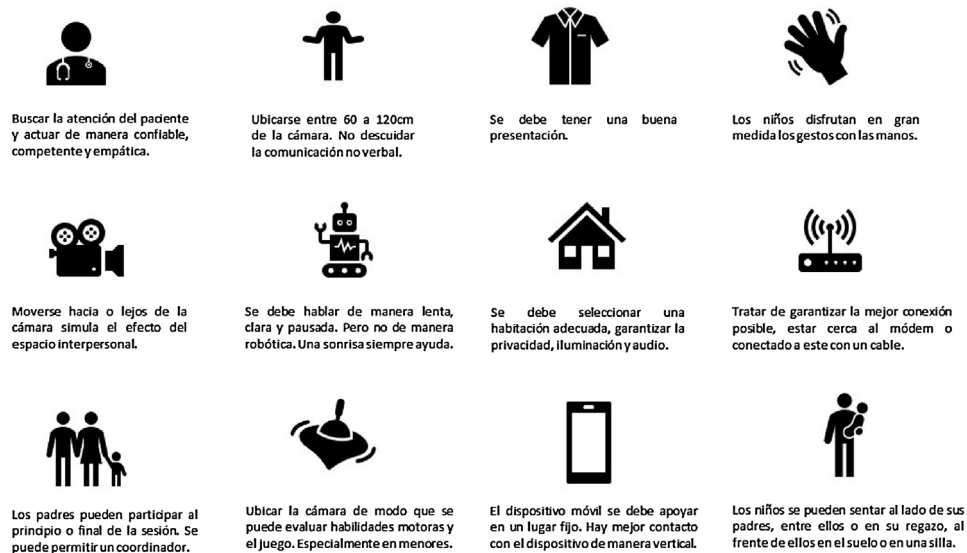
Figura 2 – Consejos prácticos para la atención de telepsiquiatría a niños niñas y adolescentes. Tomado y adaptado de Roth et al. 45 .

ha implementado una estrategia de atención para el público general y personal de salud, brindando primeros auxilios psicológicos, consulta de psicología y psiquiatría tanto a adultos como a población infantil 54 .