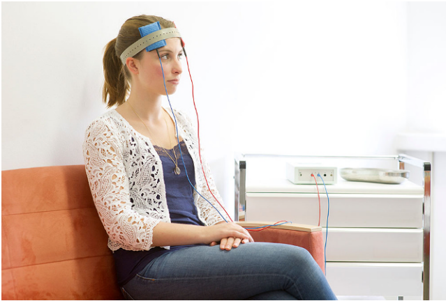
Abb. 1 ◀ Montage zweier Platten-Schwammelektroden über dem linken und rechten DLPFC, Fixierung mittels Gummiband. (Aus [57], © Steffen Hartmann, Klinikum der Universität München, Symbolbild mit Fotomodell)

gische und psychotherapeutische Therapie zwar zentrale Stützpfiler der Therapie der Schizophrenie dar, insbesondere in der Therapie der Negativsymptomatik stehen mit kognitiver Verhaltenstherapie bzw. Training sozialer Kompetenzen zwei Interventionen mit einem Empfehlungsgrad A zur Verfügung, während die Gabe von Antidepressiva lediglich einen Empfehlungsgrad B erreicht. Gerade bei therapieresistenten Verläufen sollten jedoch weitere Behandlungsstrategien erwogen bzw. entwickelt werden [5]. Hierbei werden bereits seit einigen Jahren nichtinvasive Hirnstimulationsverfahren (NIBS, „non-invasive brain stimulation“) beforscht. Neben der minimal-invasiven und fest etablierten Elektrokonzulsions-therapie hat die seit nunmehr über 30 Jahren beforschte repetitive transkranielle Magnetstimulation (rTMS) einen gewissen Stellenwert erhalten [24, 37], wobei eine neuere Metaanalyse von Aleman et al. [3] eine Wirksamkeit aktiver rTMS gegenüber Placebo nachweisen konnte. Zu diesen beiden Verfahren liegen bereits neuere Übersichtsarbeiten vor [24, 37], sodass auf Elektrokonzulsions-therapie und Magnetstimulation hier nicht eingegangen wird.