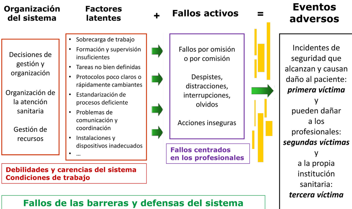
Figura 2 Modelo de accidente organizacional. Fuente: Basado en el trabajo de Reason 39 ; adaptado de Vincent et al. 40 .