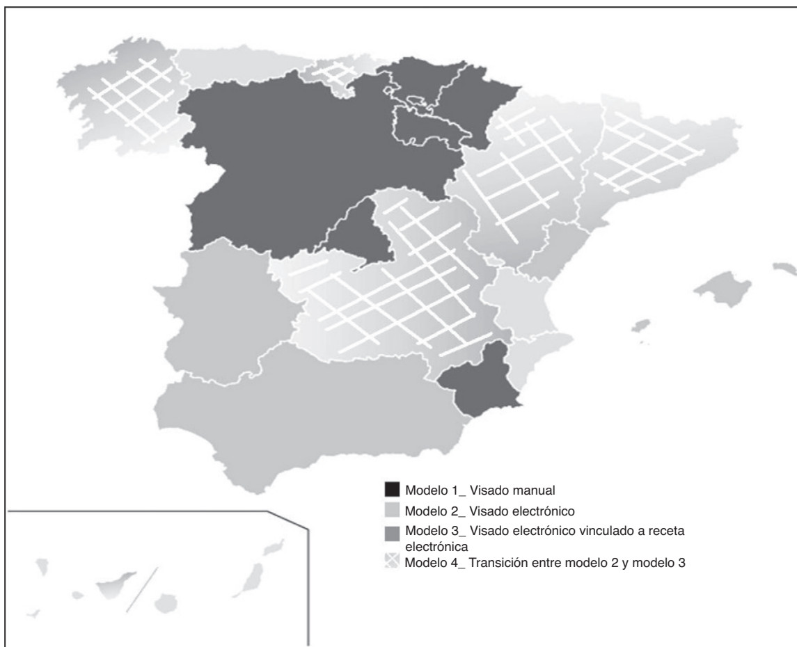
Figura 1 Modelos de visado de inspección de medicamentos implementados en las distintas comunidades autónomas, según lo comunicado por los médicos de atención primaria participantes en la fase 1 del estudio. España 2010.

[AP]), y 11 macrogestores (directores de farmacia de las consejerías de salud de las CCAA). Las entrevistas se realizaron telefónicamente entre abril y julio de 2010, con una duración media de 15 min, bidireccionales, con contexto semiabierto, grabadas (Sony IC Recorder ICD-MX20), y desgrabadas y transcritas a ordenador de manera textual. El análisis de contenido se efectuó por ejes temáticos y temas emergentes: flujos de actuación del VIM y situación del visado electrónico (VE) por CCAA, objetivos del VIM y beneficios en calidad asistencial en grupos farmacológicos, y ventajas y desventajas del VE.