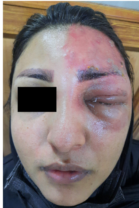
Figura 1 lesiones cutáneas papulopustulares vesiculares en el lado izquierdo del rostro, sin cruzar la línea media.

Los signos vitales de la paciente fueron normales durante la exploración física. El examen de la piel del rostro reveló lesiones papulopustulares vesiculares localizadas en el lado izquierdo, sin cruzar la línea media (fig. 1). Se aplicó tinción de fluoresceína en los ojos para examinar los signos potenciales de compromiso de la córnea, no advirtiéndose dichas lesiones. No se observaron lesiones en nariz y oídos, incluyendo el meato acústico externo. El examen neurológico fue normal. Finalizada la exploración física se diagnosticó HZO, prescribiéndose terapia antiviral y cuidados locales durante 10 días. Las lesiones mejoraron significativamente tras dicho periodo de tratamiento.