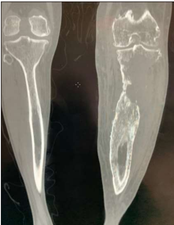
Figure 1: TDM de la jambe gauche en coupe frontale