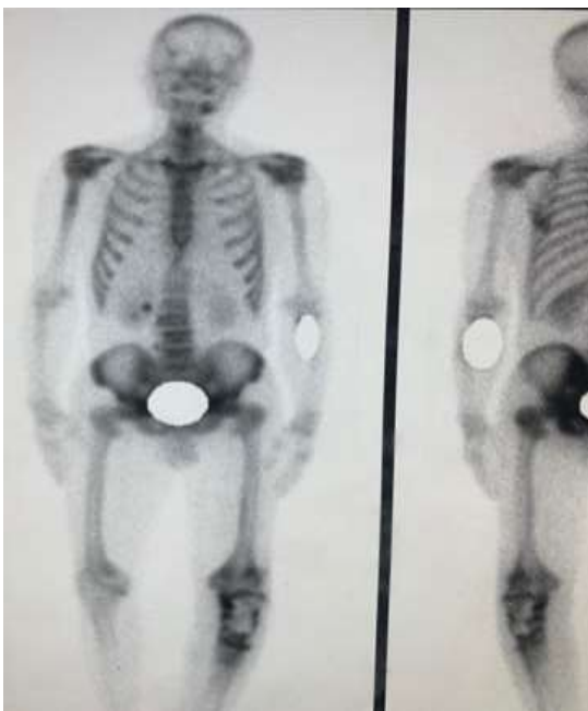
Figure 3: scintigraphie osseuse ; vue frontale (image de gauche) et vue dorsale (image de droite)