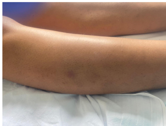
Figura 1 Lesión nodular de 2 cm de diámetro, de superficie pardusca en cara externa de la pierna derecha.

La paciente fue ingresada para observación, y se inició tratamiento con ceftriaxona, enoxaparina e hidrocortisona. Además, se pautó betametasona en crema en las lesiones cutáneas. La paciente mejoró significativamente en pocos días, permitiendo su alta hospitalaria y aislamiento domiciliario.