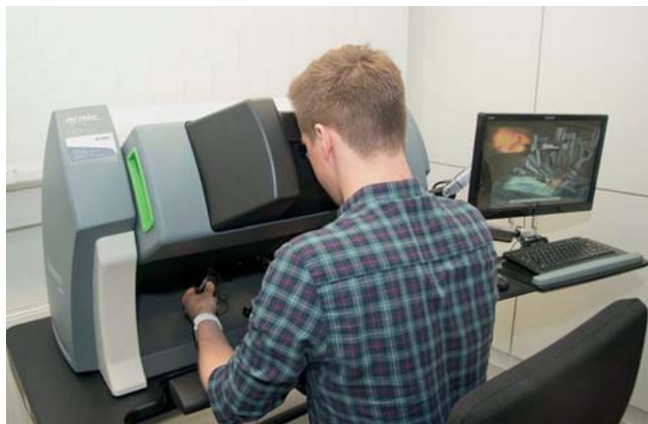
► Abb. 2 Übung zur Gefäßdissektion am virtuellen Simulator für robotische Chirurgie (Mimic dV-Trainer, Mimic Technologies Inc, Seattle, USA).

tionsaal ein [5]. Im Anschluss wird mithilfe eines VR- sowie eines AR-Headsets die Operation eines Lebertumors geplant. An einer 3. Station erproben die Teilnehmenden erste eigene Basisfertigkeiten am VR-Simulator für robotische Chirurgie (► Abb. 2 ). Fakultativ kann mit 2 VR-Brillen im Team am virtuellen Lebermodell studiert, aktiv gearbeitet und strategisch geplant werden (► Video 2 ).