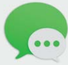
1 Digitale Kommunikation