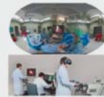
4 VR/AR & Robotik