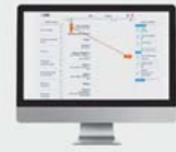
5 Künstliche Intelligenz