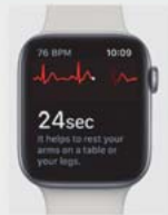
2 Apps & Smart Devices