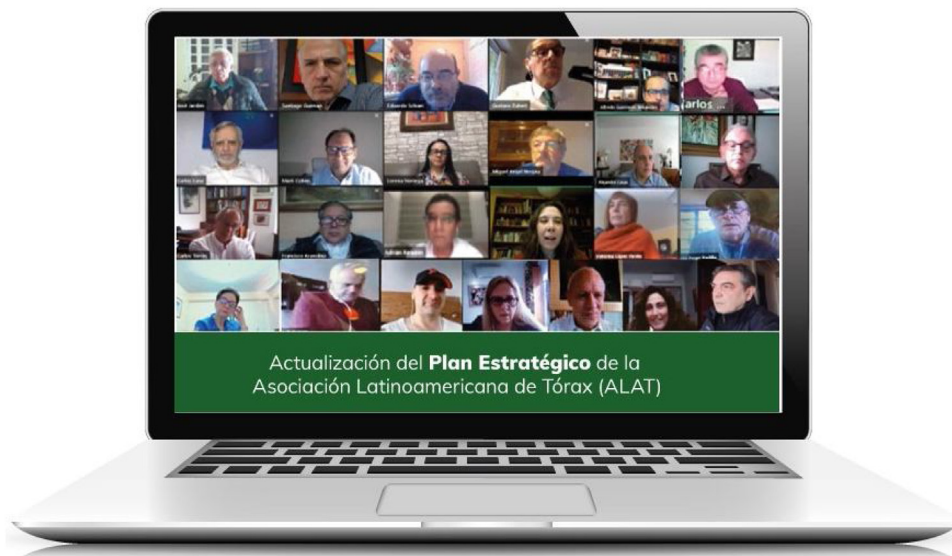
Figura 1. Participantes en el Plan Estratégico de ALAT 2021-2026.