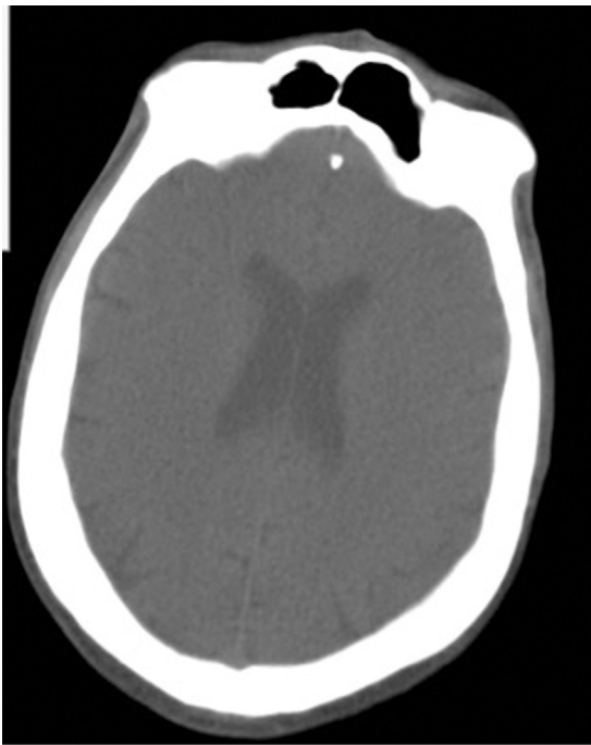
Figura 2 Tomografía computarizada cerebral: normal.